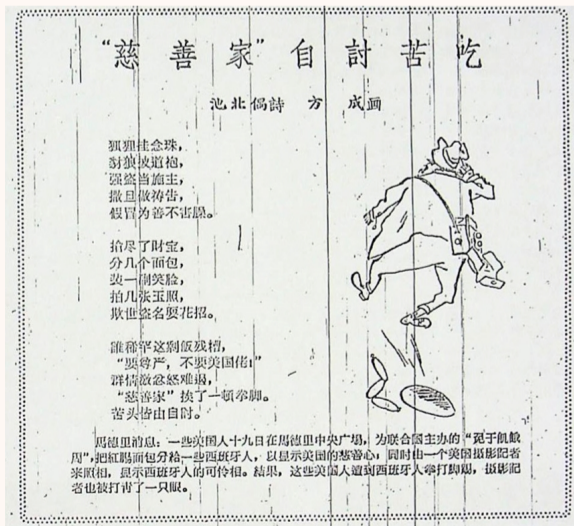
《人民日报》1963年3月23日第四版