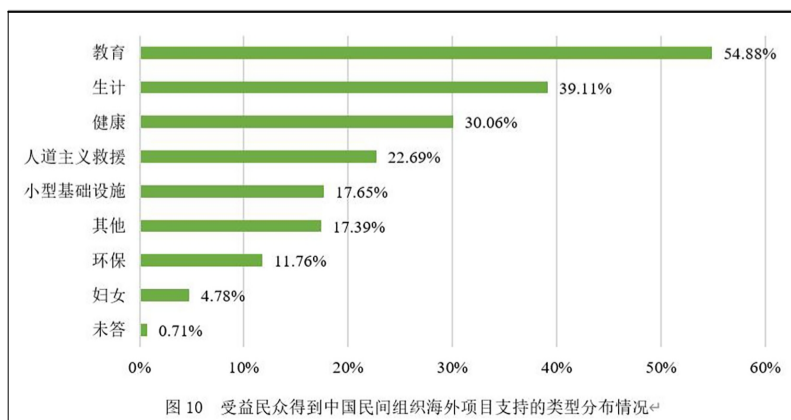
图10 受益民众得到中国民间组织海外项目支持的类型分布情况 e1

在行业发展层面,报告提出,从当前海外各方的评价来看,中国民间组织在海外的项目得到了认可,但如何能够在持续实施民生项目的同时拓展更多领域是亟待考虑的问题。报告建议,中国有志于国际化发展的民间组织要考虑如何能够在国内形成一个稳定的资源动员圈层。此外,中国公益行业中支持走出去的枢纽组织应考虑如何帮助支持国内民间组织建立海外公信力,如帮助中国民间组织提升对重要国别政治经济文化的感性和理性认知水平,提升与这些国别不同人士的沟通和交往能力。