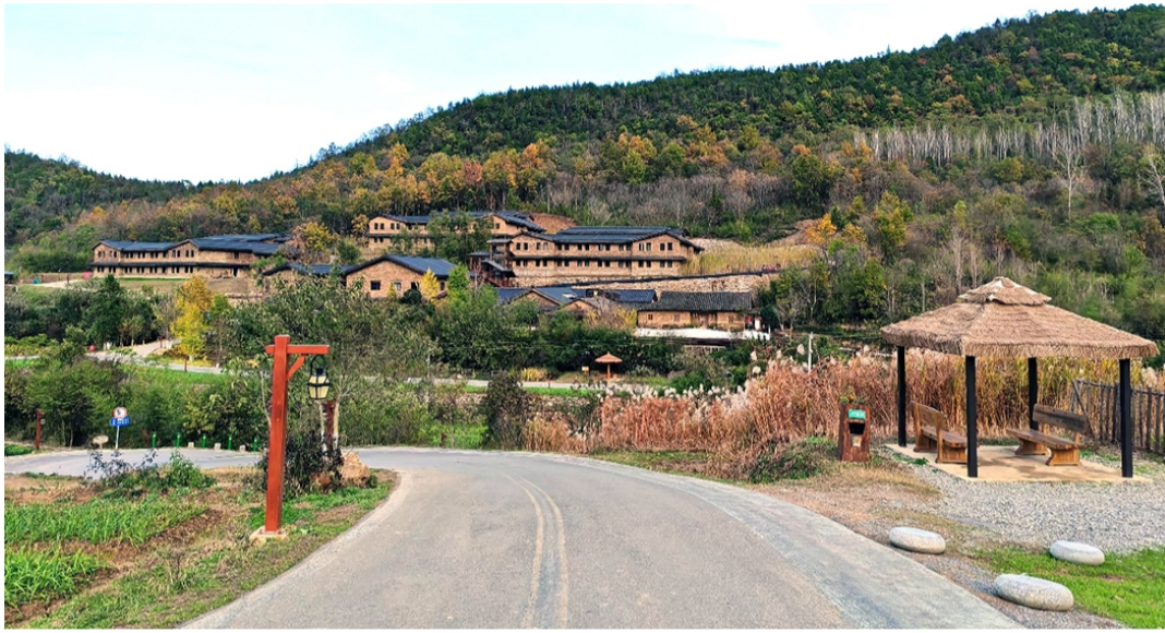
京山农场“百年老屋”酒店建筑群

古老的砖块、木板结合现代化的建筑技术,构成一个别具一格的乡村酒店建筑群。在这里,引导游客前往酒店不同客房楼宇的路牌写着陈家湾、许家湾、李家湾。