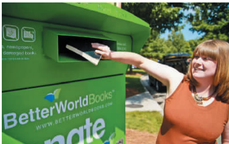
社区居民将看过的书本投进“书本回收箱”

艾伦·金(Aaron King)是“美好世界书店”历史上的第一位员工，他说他当时的工作内容就是擦书架。他骄傲地介绍自己如今的头衔——高级图