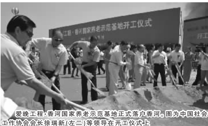
爱晚工程·香河国家养老示范基地正式落户香河。图为中国社会工作协会会长徐瑞新(左三)等领导在开工仪式上

爱晚工程项目建设的总体规划方案分为三个阶段建设:“点”的建设战略:倾力打造爱晚品牌和社会影响力。“线”的建设战略:推展实施“爱晚工程”的项目。“面”的建设战略:构建社会化养老服务合作的公益平台和产业发展平台。