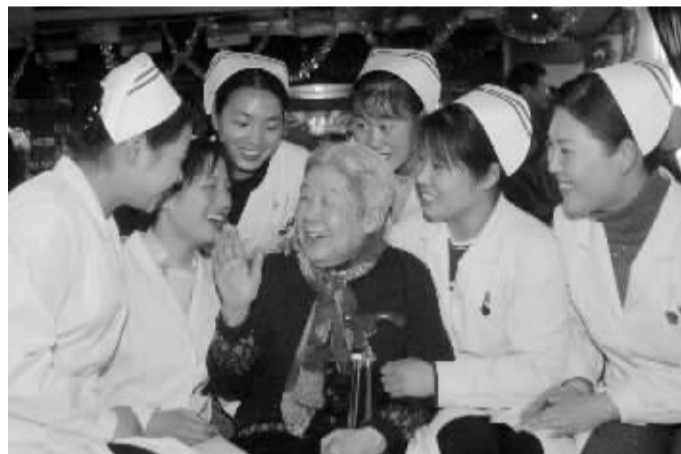
2001年4月,鹤童建起社工站

除了以协会的身份接受政府资助外,鹤童还与政府进行合作。在北京市西城区汽南社区,有一家鹤童养老院,名为“鹤童北京月坛街道敬老院”。这家养老院鹤童采取的经营模式为:与政府合作,进行托管。该家养老院的产权归西城区月坛街道所有,月坛街道办事处负责对鹤童