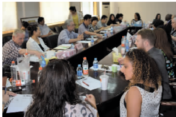
双方就中美两国社会工作领域的现状进行了深入交流