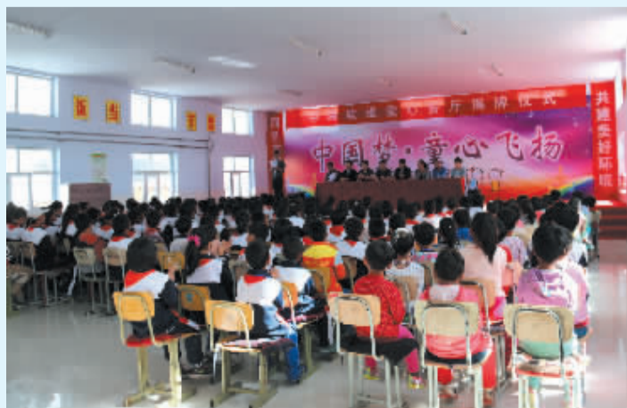
中海软银爱心餐厅揭牌仪式