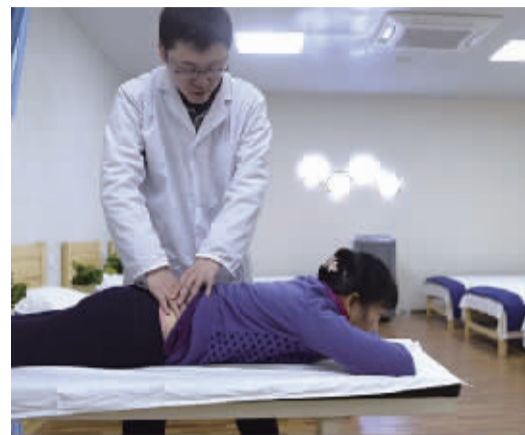
社区老人可在中心免费或低偿体验到专业中医保健师艾灸、推拿等服务

师,“老人在这里可以享受专业的理疗服务,但是价格比市场行情低了将近一半。”在天心区,专业化运营的养老服务中心基本都配有2—3名来自相关高等院校的养老专业人才。