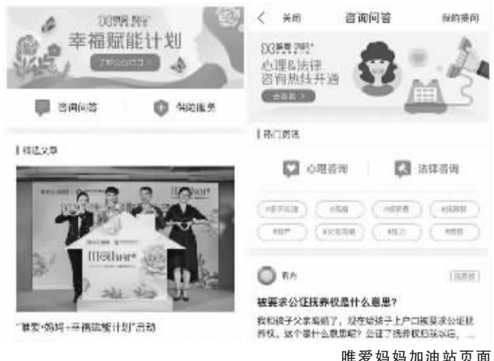
唯爱妈妈加油站页面

“社会上越来越多组织和个人期望能为赋能单亲妈妈出一份力量。然而我们也看到有很多很好的扶持单亲妈妈的项目也因为缺少外界支持而无疾而终。一个健康、可持续发展的公益生态,能够帮助各种公益组织和个人的自生长,让更多创新的关爱单亲妈妈公益项目持续运作。”崔效辉表示。