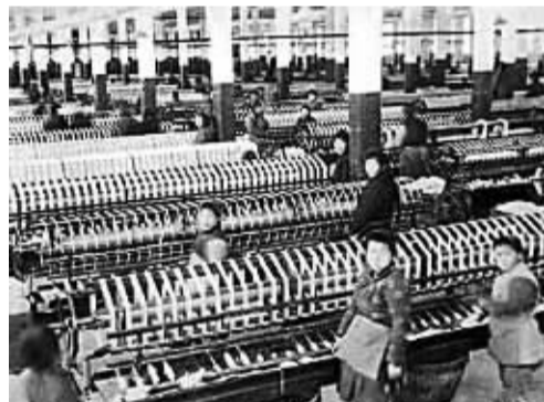
近代著名实业家张謇于1895年创办的大生纱厂

始于40年前的改革开放“把企业家请回了中国”,而与中国跻身世界第二大经济体相对应的,则是企业家群体登上历史舞台,带动中国企业不断发展壮大,推动中国经济破浪前行。改革开放打开的制度空间,让一大批民营企业脱颖而出;新世纪以来进一步扩大开放,让中国企业走向世界舞台;时至今日的科技创新,令知识密集型企业井喷式增长,中国独角兽公司在国际舞台上的戏份儿越来越重,背后正是新一代企业家的兴起。一部改革开放的历史,记录着企业家群体的创新创业,也见证着企业家精神的成长成熟。