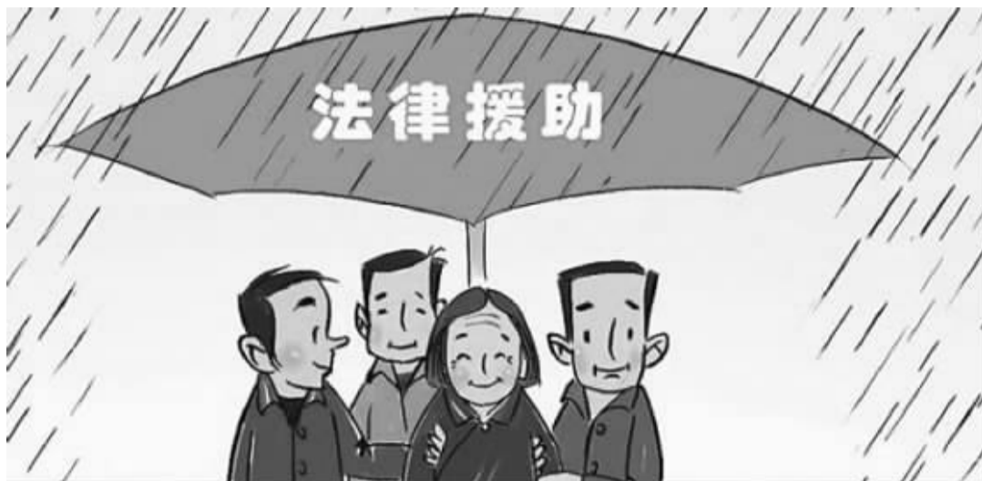
通过政府购买服务,北京市为困难老年人提供了多种多样的法律援助

建设白皮书(2017)》显示,2012年至2017年,80岁及以上高龄老人占总人口比重从3.3%提高到4.1%。百岁老人由2012年的544人,增长到2017年的833人,北京市老年人口还存在高龄人口多、长寿特征凸显特点。