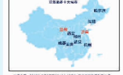
数据来源:2018年1月1日至2019年1月31日天天正能量奖励数据,最高奖励上榜城市

截止2019年3月12日,天天正能量上线以来获奖次数、人数综合排名前三的城市为:杭州、西安、重庆。