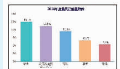
学生群体的获奖比率提升30%,首次跃至第一。这个社会好吗?他们的举动是对未来最好的回答。