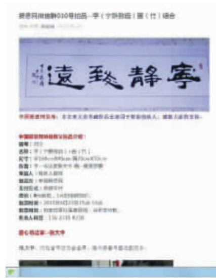
中国报恩网微信群义拍截图