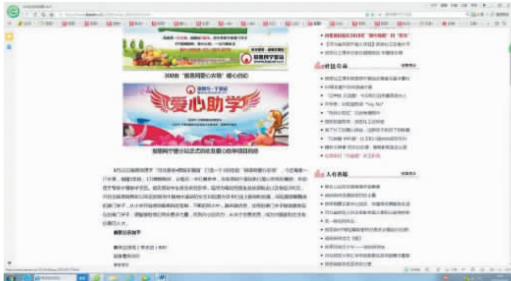
报恩网晋站正式启动,300 亩“报恩网爱心农场”暖心起航,善款公示截图