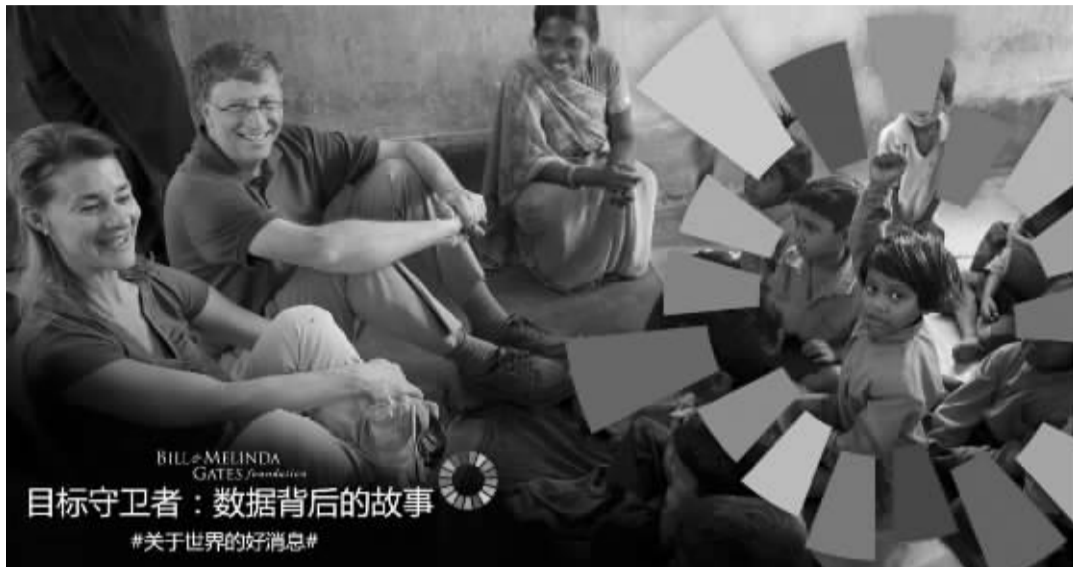
《目标守护者:数据背后的故事》年度报告由比尔和梅琳达·盖茨共同撰写

报告选取了联合国可持续发展目标中数个与健康和发展相关的指标进行追踪,其中包括儿童和孕产妇死亡率、发育迟缓、避孕用品可及性、全民健康覆盖、艾滋病毒、疟疾、极端贫困、普惠金融和环境卫生等。除了数据分析之外,报告还讲述了成绩背后的故事,指出了推动全球问题进步的原因。