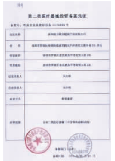
思源工程方面提供的深圳南方联合健康产业有限公司营业执照、医疗器械经营许可证、二类医疗器械经营备案凭证