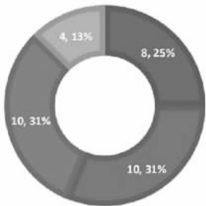
中央出台儿童政策分类情况