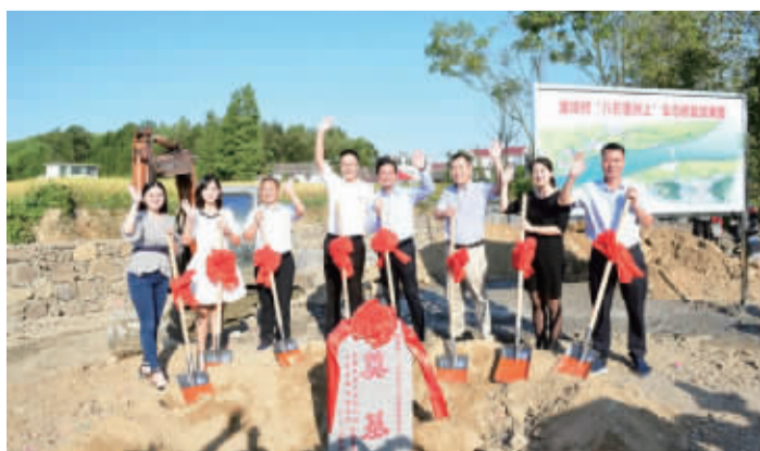
“八石里洲上”项目奠基仪式