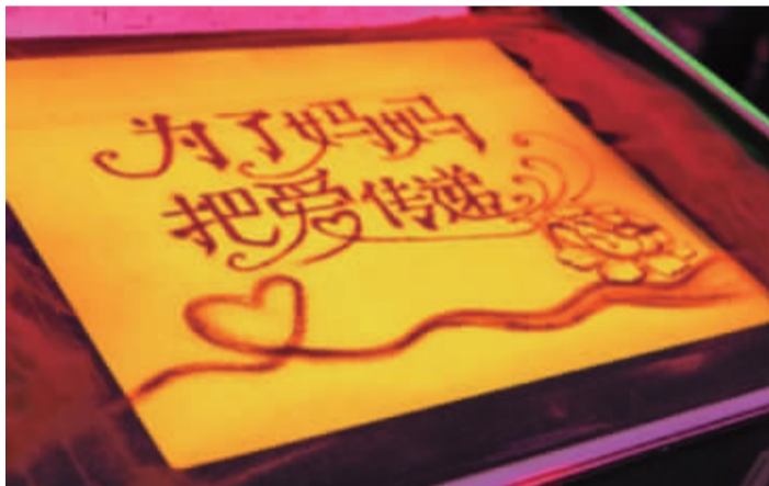
“为了妈妈”项目，在全国范围内开展贫困地区贫困乳腺癌患者救助活动

会发起针对长征沿线及其他贫困地区的“播种计划”。该项目秉持教育精准扶贫的核心理念，将精准扶贫、精准脱贫作为基本方略，结合国家开放大学社会工作学院的办学理念和特点优势，对长征沿线及其他贫困地区的学员开展教育扶贫，彻底阻断贫困的代际传递，增强学员的自我发展能力，提高贫困地区的区域发展水平。