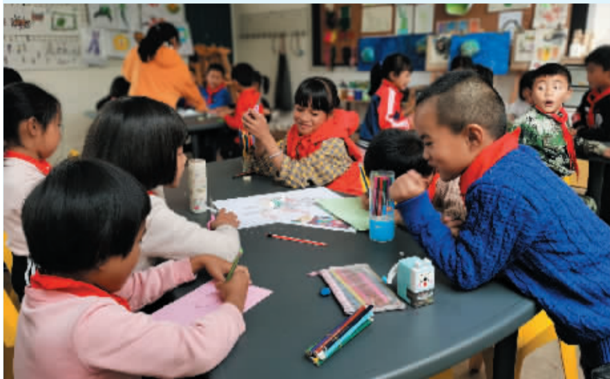
一个学期过后,哔哩哔哩美丽小学的学生各方面素质都已有明显提升