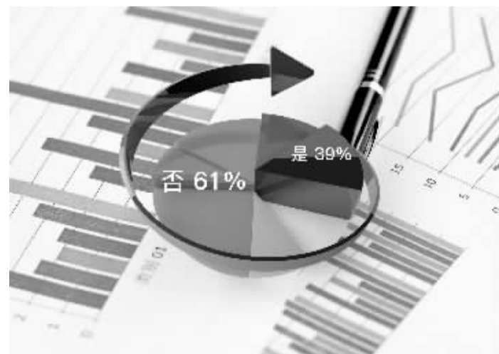
毕业生从事公益慈善相关工作的比例

现有研究生公益慈善教育项目依托公共管理、工商管理、社会工作三大学科的硕士项目在开展,三类学科背景的项目在生源、培养的人才类型、课程设置方面均有明显差异,近期社会工作硕士项目向公益慈善的拓展是现实约束下一个潜在的发展趋势。