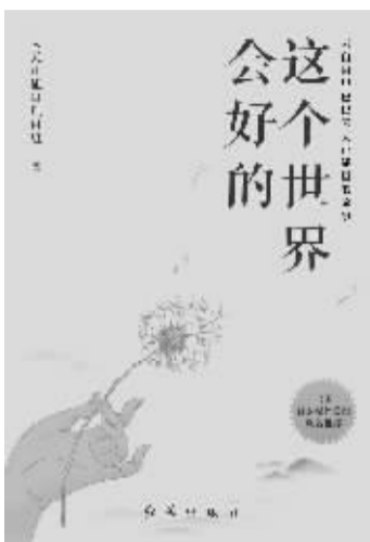
《这个世界会好的》书封

这个由马云倡议成立的公益项目，七年来投入近7000万元，奖励了8000多例凡人善举。他们的故事，近日由红旗出版社集结成《这个世界会好的》隆重推出，不仅备受出版界瞩目，更成功“出圈”，被全国百家主流媒体总编辑