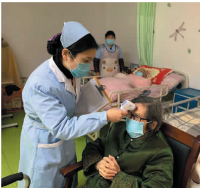
《通知》要求养老机构要加强老年人健康监测

心理慰藉方面,要加强老年人心理调节,做好正面宣传教育,为居室内老年人提供电视、广播、阅读等文化娱乐服务,利用电话、网络等为老年人提供与亲属间的亲情化沟通服务,纾解焦虑恐惧情绪,引导其保持正常作息、规律生活。对在隔离区观察的老年人要给予重点关怀,必要时及时提供心理支持服务。关注老年人的情绪变化、睡眠情况及行为表现,及时发现需要接受心理疏导者和心理危机高危人员,必要时及时提供心理支持服务。鼓励有需要的工作人员和老年人拨打当地心理援助热线,寻求帮助。有条件的养老机构可对入住老年人和工作人员心理状