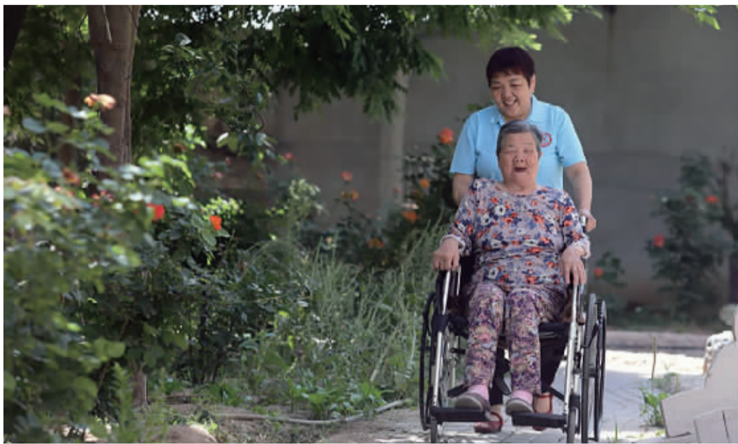
正定县塔元庄村劲松老年公寓,工作人员推着一位老人在庭院散心