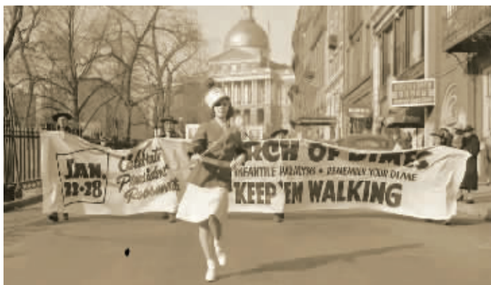
1940年,马萨诸塞州议会大厦前的“一毛钱运动”游行

1945年4月12日,罗斯福总统因脑出血在佐治亚州沃姆斯普林斯逝世,这是基金会遭遇的第二次重大危机。“他是基金会的缔造者和精神领袖,同时也是基金会募集资金的黄金招牌。多年来生日舞会项目带来数以百万计的捐款,罗斯福的死让这个项目戛然而止。”现在最重要的政治资源没有了,一些曾经支持基金会募款的影星和影院开始转向。而这时美国慈善领域正在兴起的联合劝募也在切分他们募捐市场的蛋糕。征服脊髓灰质炎的使命如何