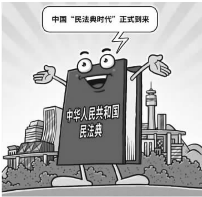
中国民法典诞生(新华社发 程硕/作)

针对留守儿童亲情缺失的问题,新修订的未成年人保护法严禁监护人将孩子“一托了之”,要求给予未成年人亲情关爱;针对群众担忧的“垃圾围城”问题,