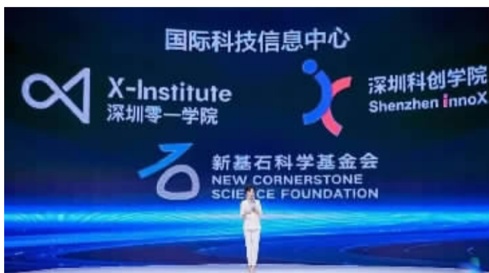
11月15日,由腾讯发起的新基石科学基金会宣布落地深圳。腾讯将在 10 年内投入 100 亿元,支持一批杰出科学家开展基础研究

另外一笔捐赠投向科技领域。11月15日,在 2022 西丽湖论坛现场,新基石科学基金会宣布落地深圳。据悉,该基金会由腾讯公司发起,腾讯公司计划在 10 年内投入 100 亿元,支持一批杰出科学家潜心基础研究,实现“从 0 到 1”的原始创新。今年 7 月,“新基石研究员项目”已启动首次申报,项目设置数学与物质科学、生物与医学科学两个领域,同时鼓励学科交叉研究。