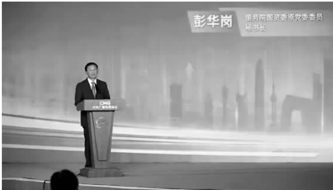
国务院国资委原党委委员、秘书长彭华岗

国家电投党组书记、董事长,央企 ESG 联盟理事长钱智民在演讲中表示,ESG 是一个理念,同时更重要的是实践。他介绍,国家电投依托国企改革三年行动,加强企业治理能力和体系现代化,将 ESG 目标融入国家电投的 2035 一流战略和“十四五”规划,优化升级方案,制定建设世界一流企业实施方案,提出到 2035 年 ESG 指数(含碳排放强