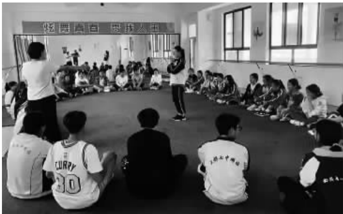
助力山娃娃放飞梦想项目合作学校开展心理健康日主题活动(项目资料图)

记者了解到,该生家庭困难属实,实际执行中,机构共对文案中男生进行过两次帮扶,总帮扶金额为7000元,不存在过度帮扶的情况。据学校老师反馈,在