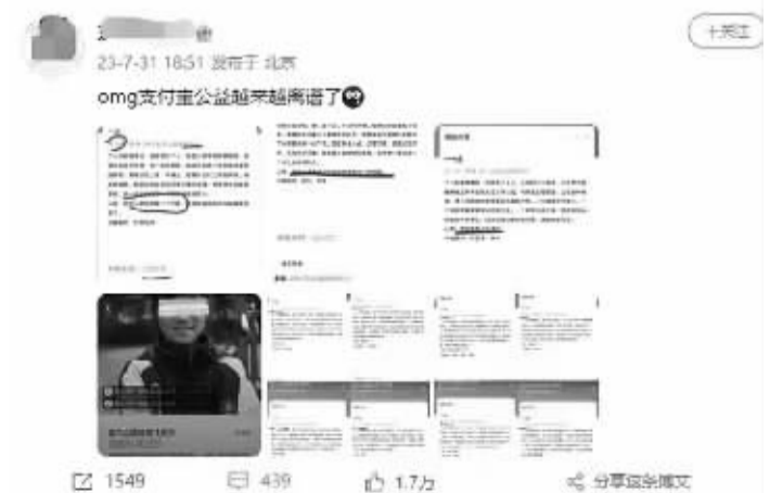
微博网友对支付宝公益平台项目提出质疑

此外,陆璇指出,还要考虑其他类型的公开募捐服务平台(如广播、电视、报刊以及电信运营商)是不是要对慈善组织的违法活动、个人或机构通过其开展的其他违法行为(比如电信诈骗)承担连带责任。“显然,立法要考虑的因素还有很多。”