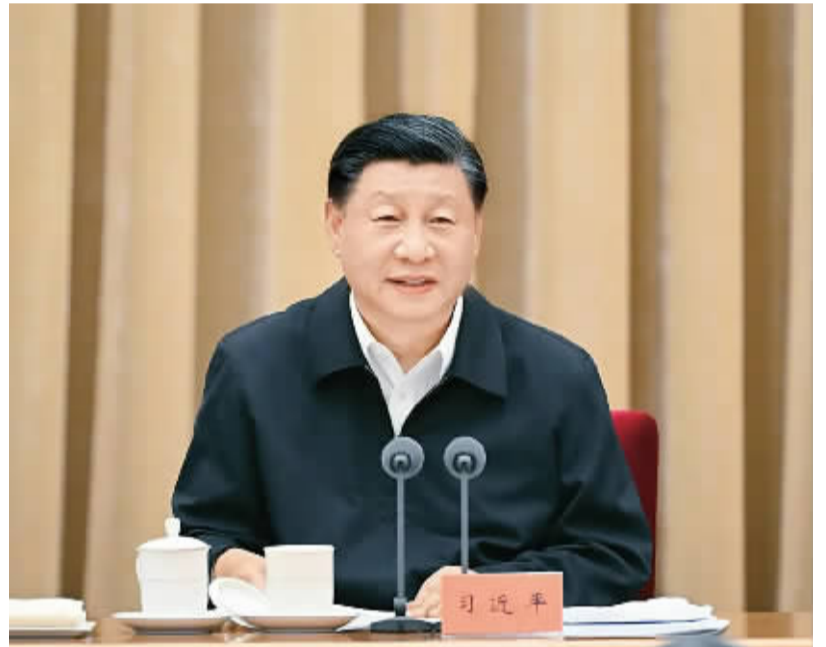
2023年7月17日至18日,全国生态环境保护大会在北京召开。中共中央总书记、国家主席、中央军委主席习近平出席会议并发表重要讲话。